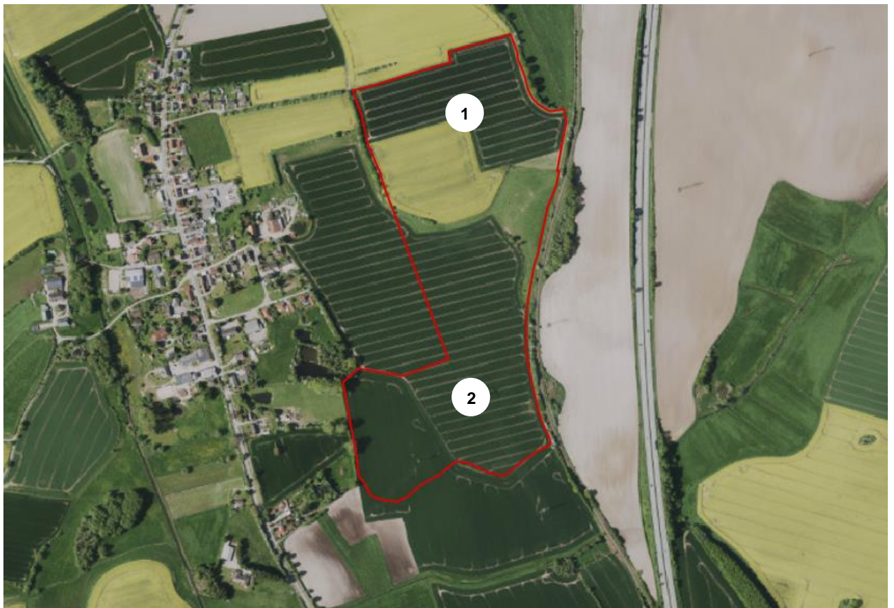
Abb.: Luftbild mit Geltungsbereich, Digitaler Atlas Nord

Der Teilbereich 1 im Norden wird durch Knickstrukturen vom Teilbereich 2 getrennt. Das Umspannwerk mit Trassen und den freigehaltenen Schneisen sowie die Zuwegung liegt im Teilbereich 2.