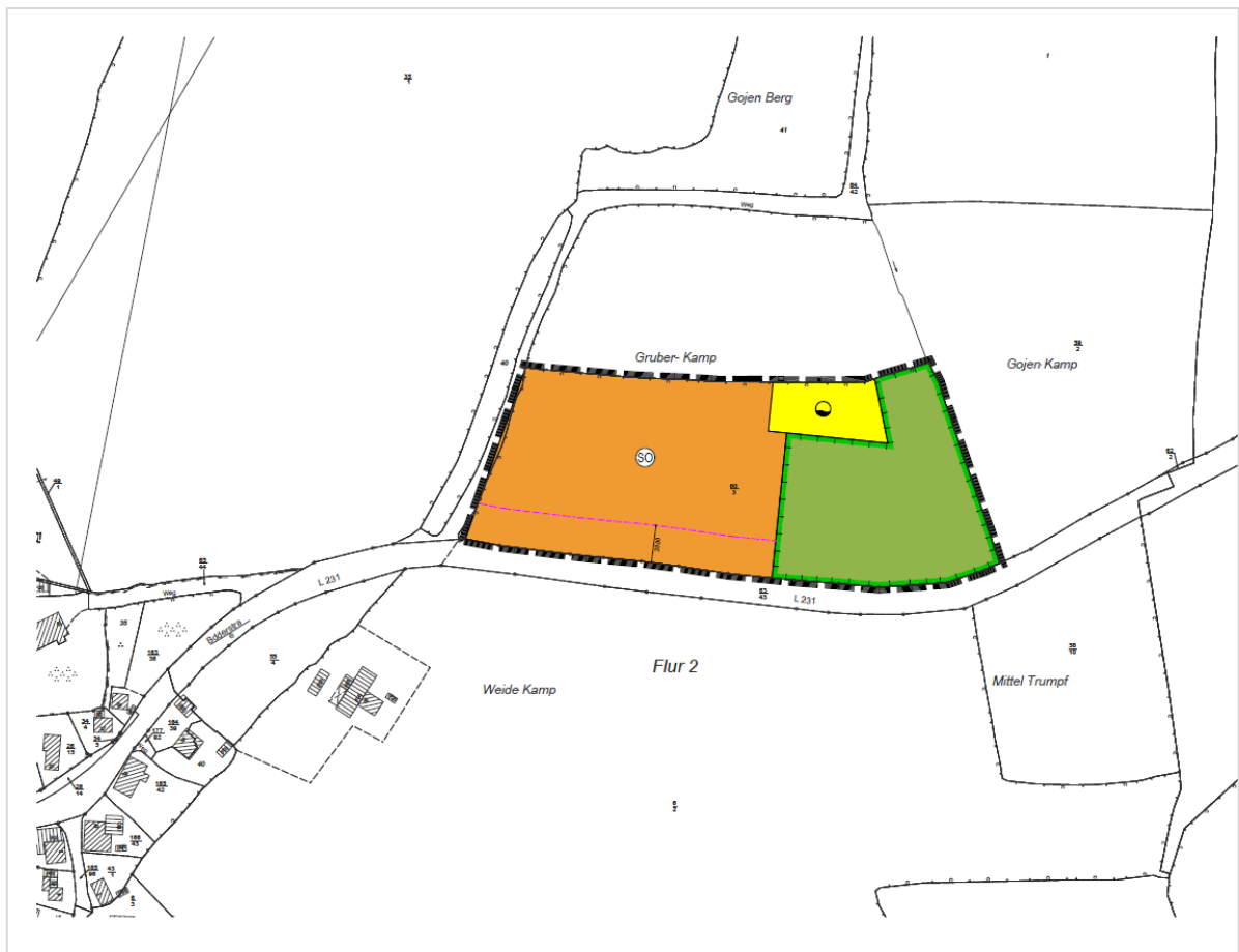
Abb.: Ausschnitt 4.FNPÄ der Gemeinde Riepsdorf, 2017

Östlich von Gosdorf, außerhalb des Ortsteils ist eine Lager- und Aufbereitungsfläche für Holzhackschnitzel eines ortsansässigen Betriebes aus Gosdorf geplant. Dafür wurde im Jahr 2016/2017 die 4. Flächennutzungsplanänderung durch die Gemeinde Riepsdorf aufgestellt, die ein Sonstiges Sondergebiet – Holzaufbereitungsplatz und Maschinenhalle – darstellt. Im Rahmen der Aufstellung der 4. FNPÄ wurden die entstehenden Geruchsimmissionen durch ein Gutachten ermittelt und bewertet. Die Geruchsbelastung für die nächstgelegene Wohnbebauung und hier v.a. das Wohnhaus östlich des Ergänzungsbereiches, welches sich näher an dem geplanten Sondergebiet befindet, beträgt max. 2 % der Jahresstunden. Im Bereich der Einbeziehungsfläche liegt der Wert unterhalb von 2 % der Jahresstunden. Gemäß der Geruchsimmissions-Richtlinie (GIRL) ist dadurch von keiner erhöhten Belastung aufgrund der geplanten Anlage auszugehen.