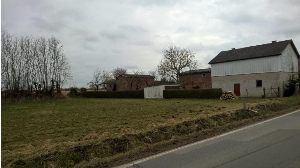
Abb.: Foto, Ergänzungsbereich

Der Ergänzungsbereich wird im Norden durch die Landesstraße und den vorhandenen Graben und im Süden durch eine Knick/Gehölzreihe begrenzt. Im Westen grenzt ein Wohngrundstück an den Einbeziehungsbereich. Die vorhandene Zufahrt mit Garage und Hecke werden in den Geltungsbereich der Satzung mit einbezogen.