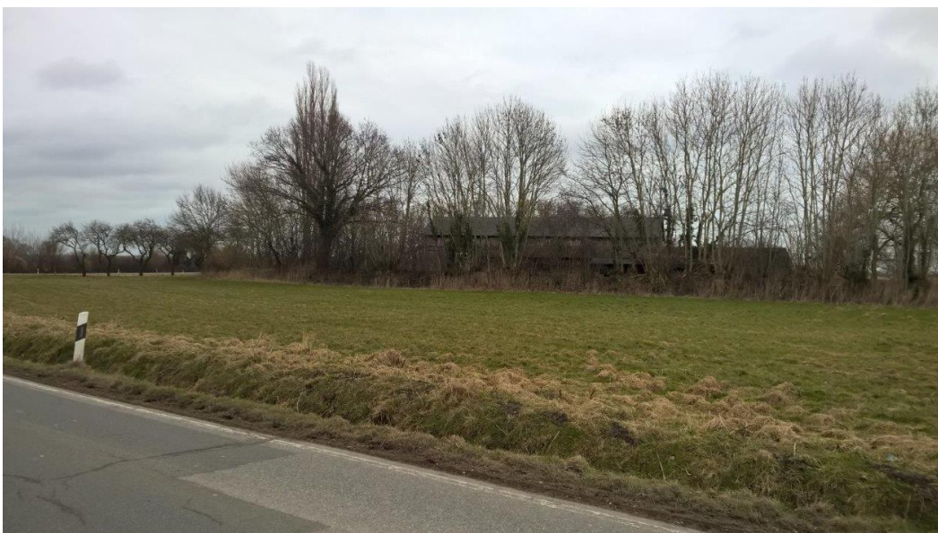
Abb.: Foto, Ergänzungsbereich

Der Ergänzungsbereich stellt sich als überwiegend als Grünlandfläche / Wiese dar. Der schmale Streifen im Westen wird durch das Wohngrundstück als Hof- und Gartenfläche genutzt und ist dem besiedelten Bereich zuzuordnen. Abgesehen davon befinden sich keine versiegelten Flächen im Geltungsbereich.