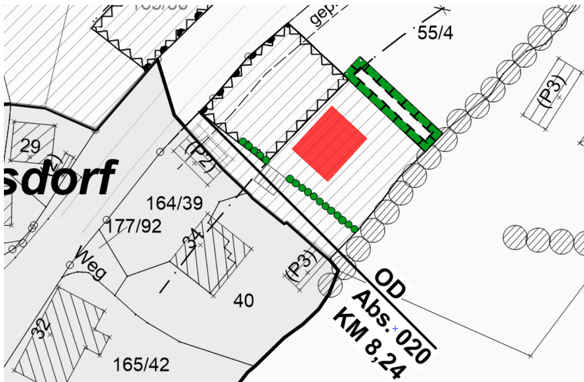
Abb.: Beispiel Bebauungsmöglichkeit

Mit der Aufstellung der Satzung über die 2. Ergänzung der Abrundungssatzung für den Ortsteil Gosdorf wird eine Außenbereichsfläche in den im Zusammenhang bebauten Ortsteil einbezogen. Diese einbezogene Fläche ist bereits durch die bauliche Nutzung des angrenzenden Bereichs geprägt. Südwestlich des Einbeziehungsbereiches bestehen bereits Wohngrundstücke, die den Teilbereich wesentlich prägen. Tatsächlich neue Baumöglichkeiten ergeben sich nur im rückwärtigen Bereich, wo die Errichtung von einem Wohngebäude geplant ist.