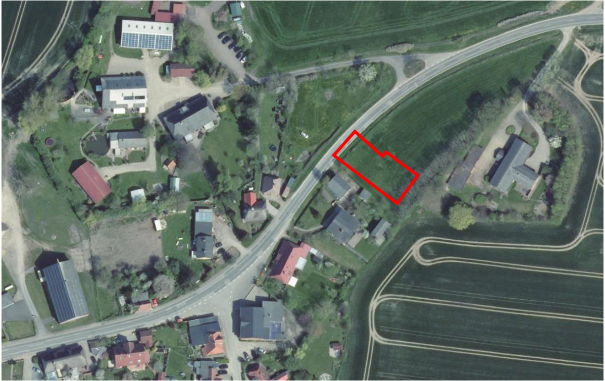
Abb.: Ausschnitt Luftbild, Quelle: Digitaler Atlas Nord

Die Gemeinde Riepsdorf hat am ..... die Aufstellung einer Ergänzung der geltenden Abrundungssatzung in Gosdorf beschlossen. Ziel ist es ein weiteres Baugrundstücke zu ermöglichen.