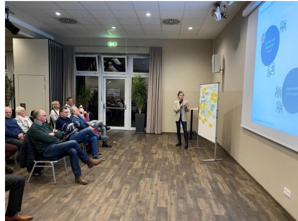
Abbildung 1: Impressionen der Veranstaltung

Während des Stationen-Rundgangs sind durch die rege Mitmachbereitschaft eine Fülle von Anregungen, Vorschlägen, Bedürfnissen, Zweifeln, Potenzialen und Ideen für die drei Themenbereiche erfasst worden. Diese werden in das Ortsentwicklungskonzept einfließen und helfen dabei, konkrete Maßnahmen zu definieren.