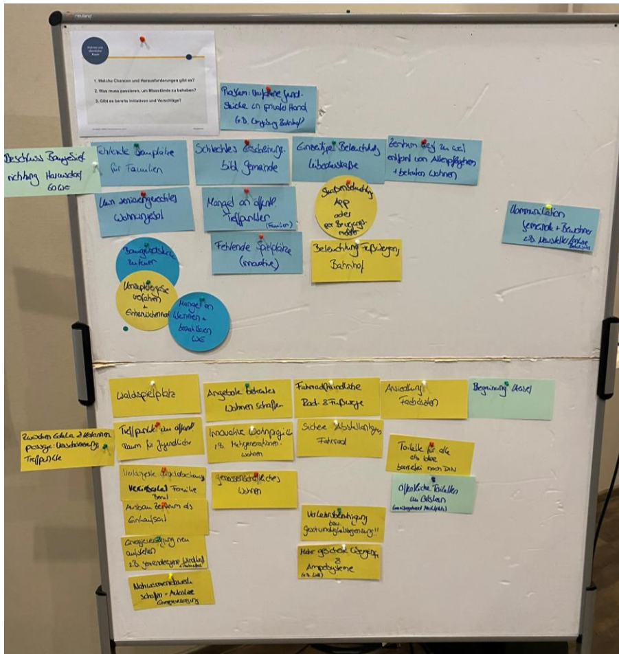
Abbildung 3: Wohnen und öffentlicher Raum