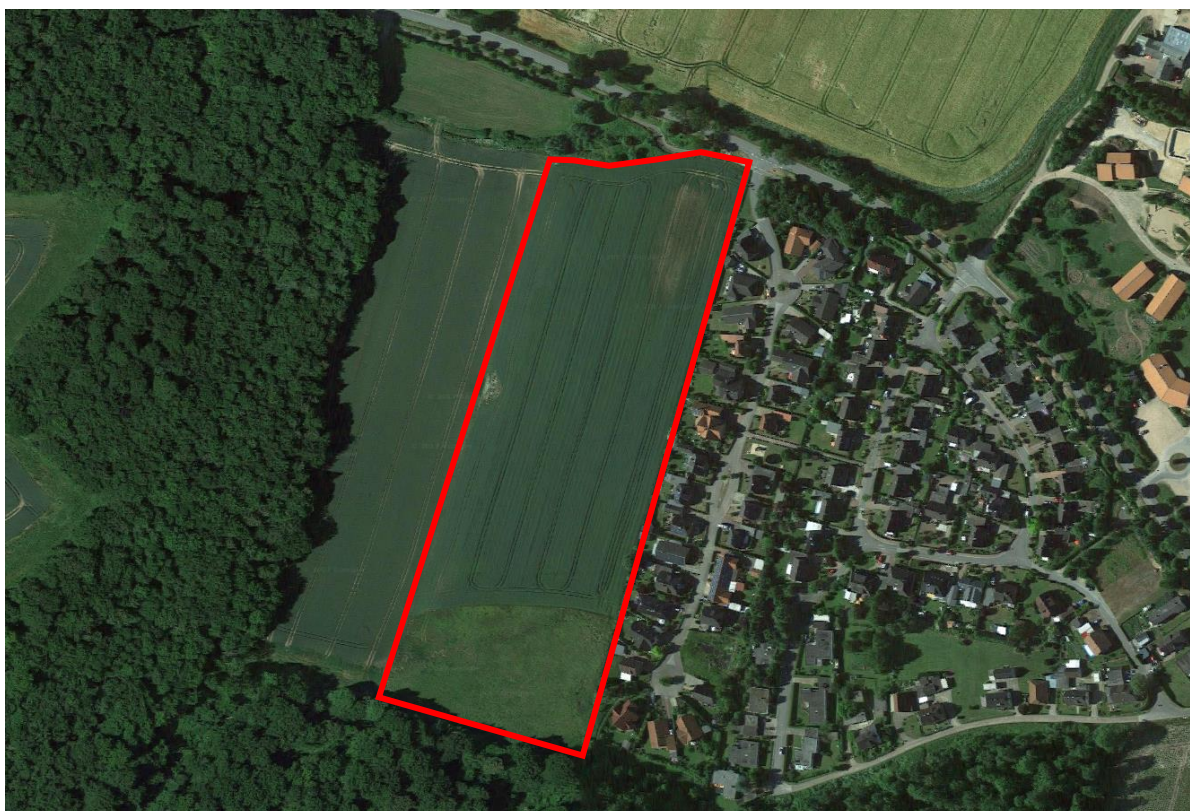
Luftbild, Quelle: Google earth

Das Plangebiet liegt am nordwestlichen Ortsrand von Lensahn, südlich der Lütjenburger Straße und westlich der Hirschkoppel. Östlich des Plangebiets erstreckt sich die vorhandene Wohnbebauung entlang der Hirschkoppel. Südlich schließen sich direkt Waldflächen an, die sich auch in westliche Richtung bis an die Lütjenburger Straße erstrecken. Das Plangebiet selbst wird überwiegend intensiv landwirtschaftlich genutzt. Am südlichen Plangebiets befindet sich eine Ackerbrache. Im Norden wird das Plangebiet durch den Mühlenbach mit vereinzelt Gehölzen begrenzt. Das Gelände ist bewegt und fällt von Südwest nach Nordost ab.