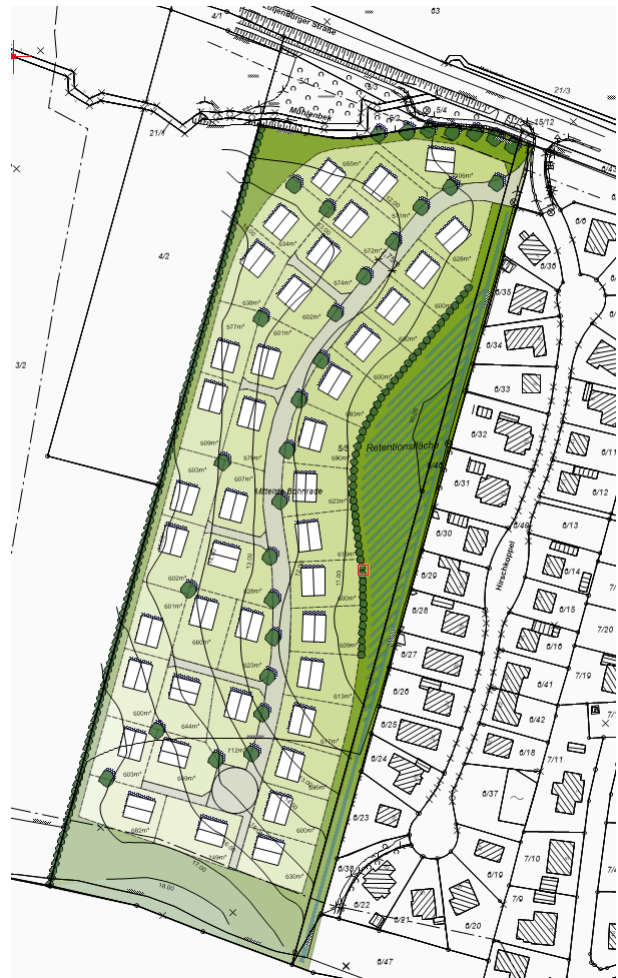
Entwurfskonzept „Mittelste Bohnrade“, 2016 Ploh

Die Gemeinde Lensahn hat sich umfassend mit den Bebauungsmöglichkeiten westlich der Hirschoppel befasst und ein Entwurfskonzept erarbeitet. Die Gemeinde strebt unter Beachtung einer behutsamen Einfügung der Neubebauung in das Orts- und Landschaftsbild eine auch wirtschaftlich optimale Inwertsetzung der Flächen an. Somit berücksichtigen die Gebäudeanordnung die topografische Situation im Plangebiet. Zudem wird in Anlehnung an das benachbarte Wohngebiet an der Hirschoppel auch hier eine Haupteinfahrtsstraße vorgesehen, die im Süden in einem Wendehammer endet mit fußläufiger Anbindung in Richtung Wald.