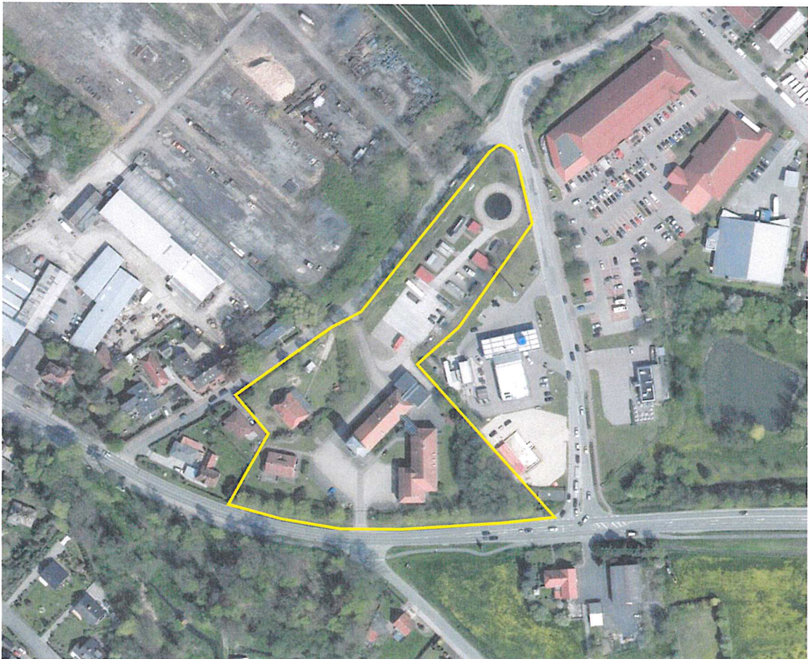
Abb.: Digitaler Atlas Nord