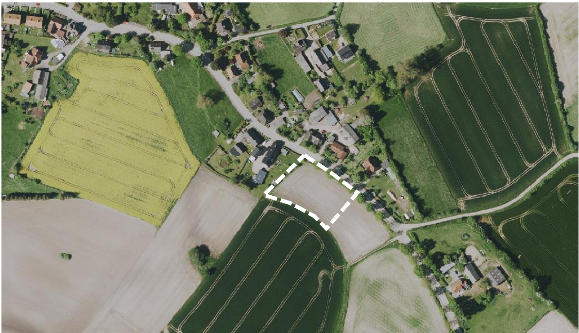
Abb.: Luftbild mit Ergänzungsbereich, Quelle: Digitaler Atlas Nord

Nördlich und nordwestlich grenzt die bebaute Ortslage Schwienkuhl an das Plangebiet an. Nach Süden und Südwesten liegen landwirtschaftlich genutzte Flächen.