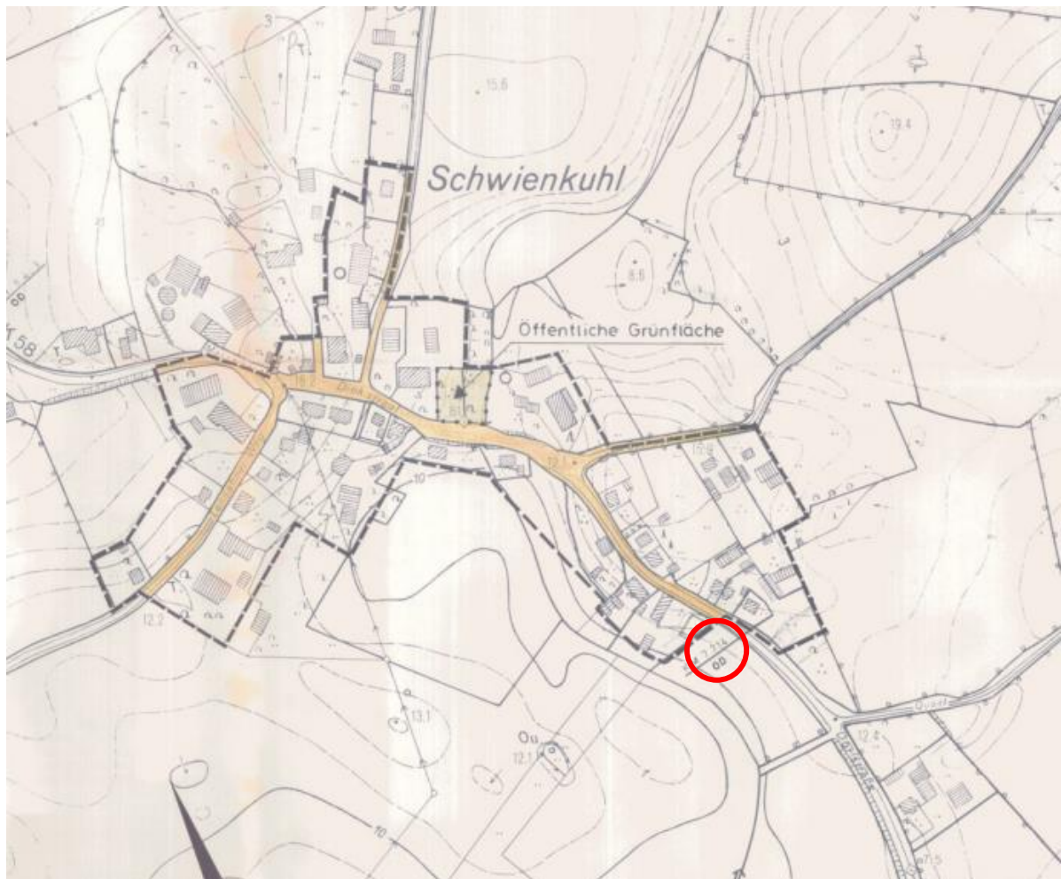
Abb.: Auszug aus der Satzung über die im Zusammenhang bebauten Ortsteile der Gemeinde Kabelhorst , 1992.

In der Gemeinde Kabelhorst besteht der Wunsch in der Ortschaft Schwienkuhl den im Zusammenhang bebauten Ortsteil, um zwei Baugrundstücke zu arrondieren. Die Gemeinde unterstützt das Vorhaben und nimmt dies zum Anlass, für den vorgenannten Teilbereich gemäß § 34 Abs. 4 Satz 1 Nr.1 und 3 BauGB eine Satzung über die 3. Ergänzung der Abrundungssatzung Nr. 1 für die Ortschaft Schwienkuhl der Gemeinde Kabelhorst aufzustellen.